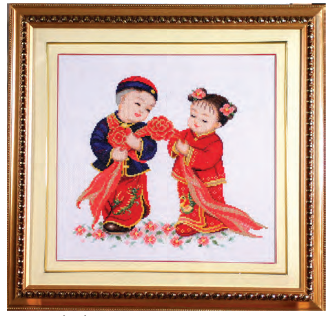
《新禧》孙开芳; SCCS Grandparent