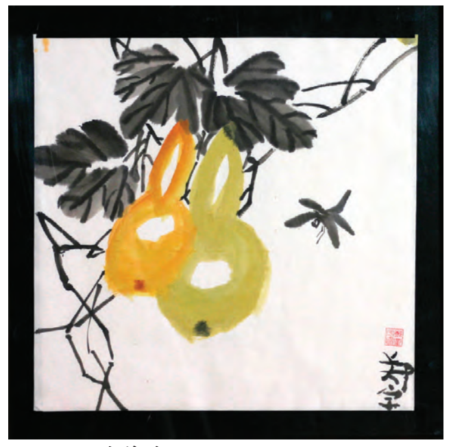
《葫芦藤》 郑宇; Age: 8; Grade 2