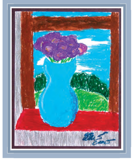
《 A Vase on the Windowsill 》 Elaine Cao,曹依兰; Age: 9; Grade 5