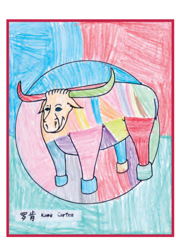
《 斗牛 》 罗肯; Age: 8; Grade 1 《 牛年快乐 》 路佳娜; Grade 3