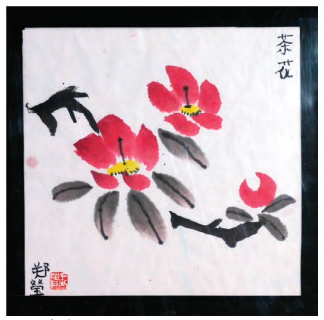
《 茶花 》 Ying Zheng, 郑莹; Age: 9; Grade 3