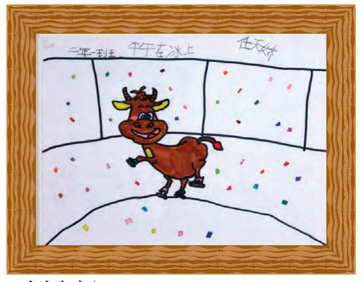
《 牛牛在冰上 》 Tianjiao Ren, 任天娇; Age: 7; Grade 2