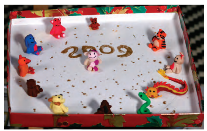
The Chinese Zodiac Elaine Cao,曹依兰; Age: 9; Grade 5