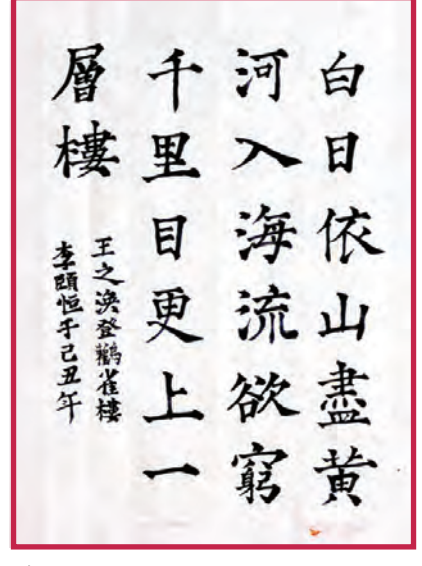
《唐诗一首》李颐恒; Age: 10; Grade 5