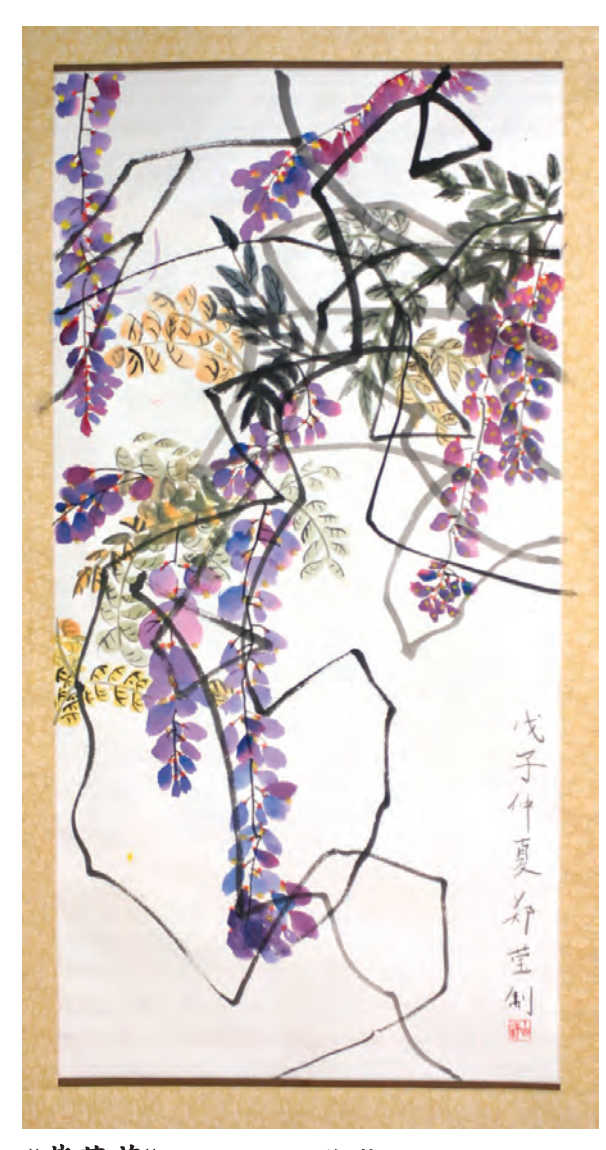
《紫藤花》Ying Zheng, 郑莹; Age: 9; Grade 3