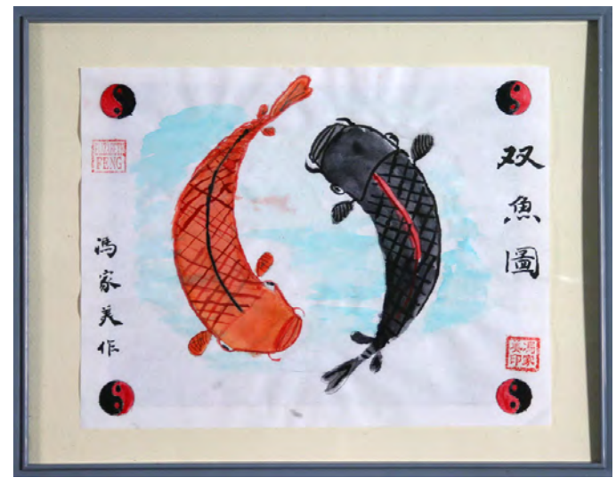
《 双鱼图 》 冯家美; Age: 12; Grade 4