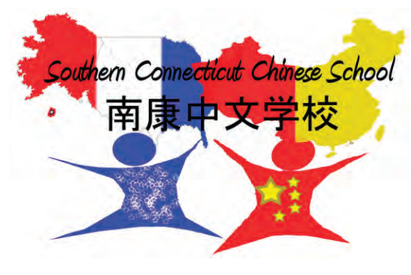
SCCS Poster Shirley Xu, 徐婷婷; Age: 15; Grade 8